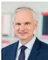
Dr. Johannes Teyssen